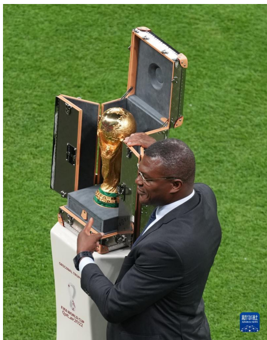
11 月 20 日，法国队名宿德塞利在海湾球场展示大力神杯。

大力神杯首次在 1974 年世界杯用于颁奖。一直到 2002 年，国际足联沿用了冠军球队足协保管 4 年，下届世界杯再返还给国际足联的政策。但从 2006 年德国世界杯开始， “正品”奖杯只会用于颁奖，冠军球队会获赠镀金的复制品奖杯。 每届世界杯冠军所拥有的“特权”，就是将自己国家或地区的名字刻在大力神杯的杯座下。据 World Soccer 网站称，2038 年世界杯之后，大力神杯底部将没有刻字空间。